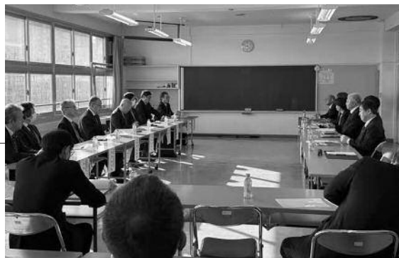
弘前市校長会役員との意見交換の様子