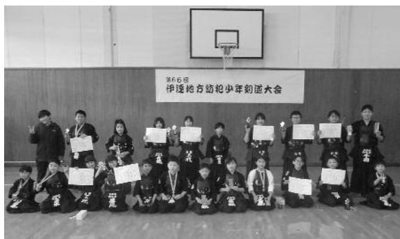
町内道場出場選手の皆さん