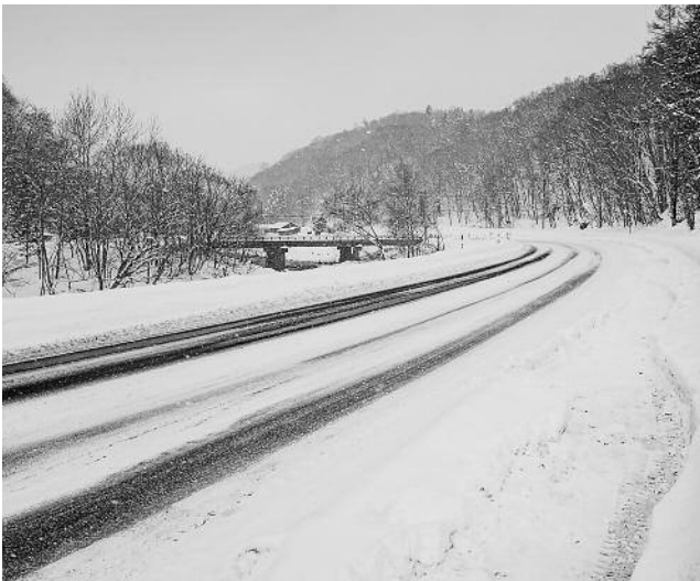
完成当初の国道453号蟠溪道路