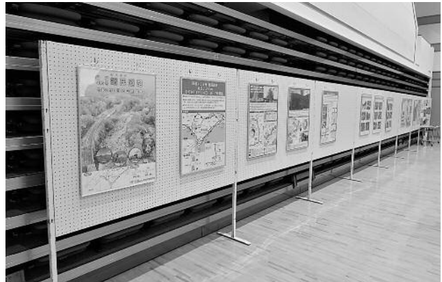
会場後方に設定された工事概要の紹介パネル