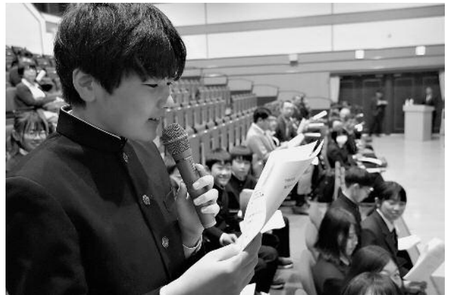
インタビューに回答する生徒 皆さん、やる気満々です！