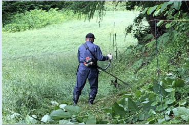
電気柵周辺の草刈り