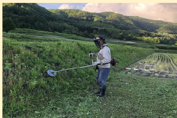
農地法面の草刈り