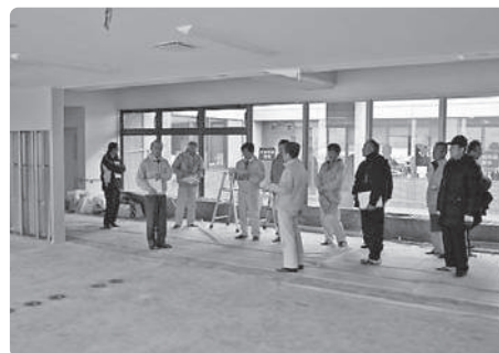
保健センター改修状況