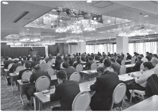
議員研修会の様子

「町村の行財政運営を考える」と題して講演があり、講師には、道庁のOBであり、当別町の助役