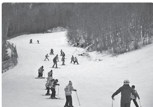
スキー教室の様子

小学校1・2年生は年間5時間の体験学習を行っており、他市町と比較しても充実した英語教育をしている。将来の対策については、先行実践を行っている学校等の事例研究や教職員が研修を受講し、授業のあり方をALTE（外国語指導助手）と協議しながら進めたい。