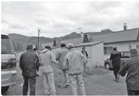
仲洞爺団地建てかえ説明