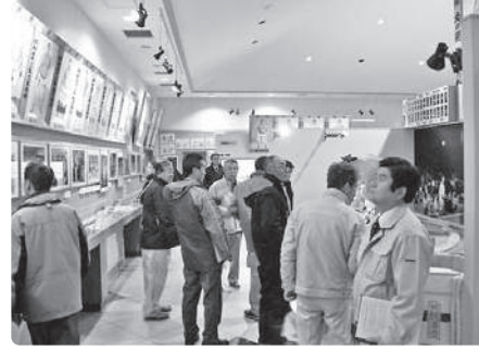
北の湖記念館視察