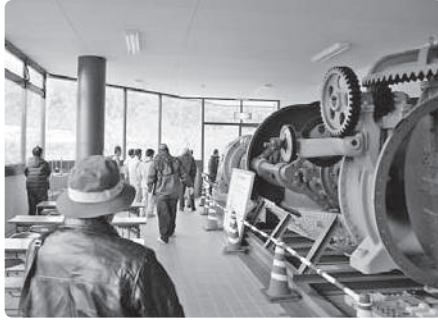
寄贈された水力発電機

外国人団体客等来館者のニーズに合わせた館内の改修については説明を受けた。費用は数千万円になるため、数年の計画で実施するとの