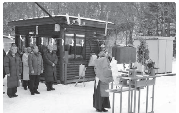
オロフレスキー場安全祈願祭