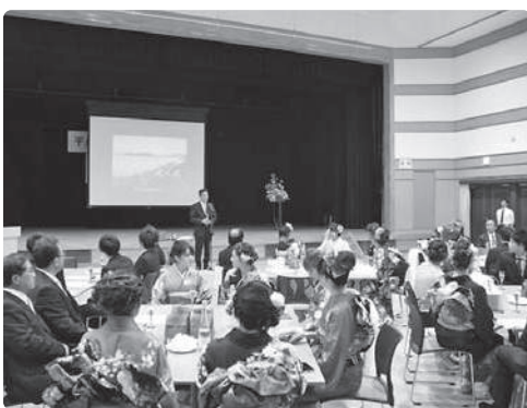
成人式懇親会の様子

町長 各地域政策は私からは示していないが、限られた財源を使いやすく町民全体で活用していく