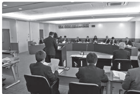
第4回定例会の様子