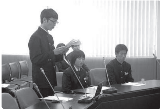
子ども議会の様子

業振興を牽引して頂きたいと考えている。さらに、様々な課題を抱えている農家の相談役も担っていただければと思っている。