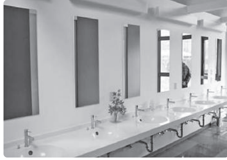
改善センター洗面台設置状況

可を受けた際に指導を受けたことから洗面台を設置した。改善センターは避難所の指定にもなっていることから災害時にも活用できる。