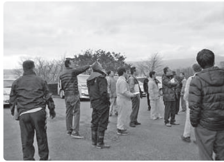
森と木の里センター視察