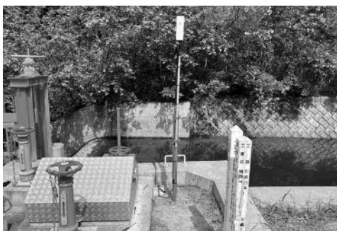
幸内ファームポンド

ITを活用した農業農村インフラ管理の省力化・高度化を図り、スマート農業の実装に必要な情報通信環境の整備を図ります。