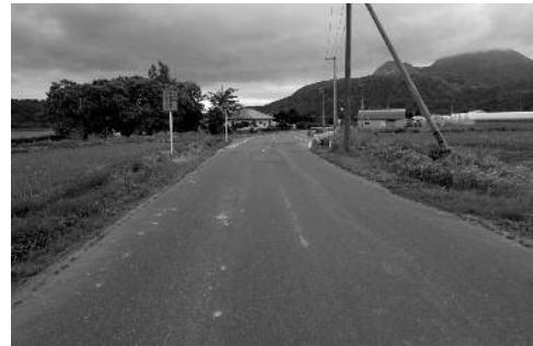
町道滝之町中島1号線

事業延長約1,200mのうち、町道紫明苑線の交差点から久保内方向に約750mの工事が完了しています。今年度も、国の交付金の配分額に合わせた事業規模で整備を進める予定です。