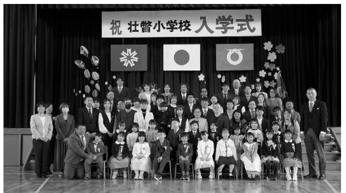
壮瞥小学校 入学式

小中学校では、西胆振の市町で同じ種類の端末を導入しており、これは、教員が異動しても、すぐ使えるように配慮している。