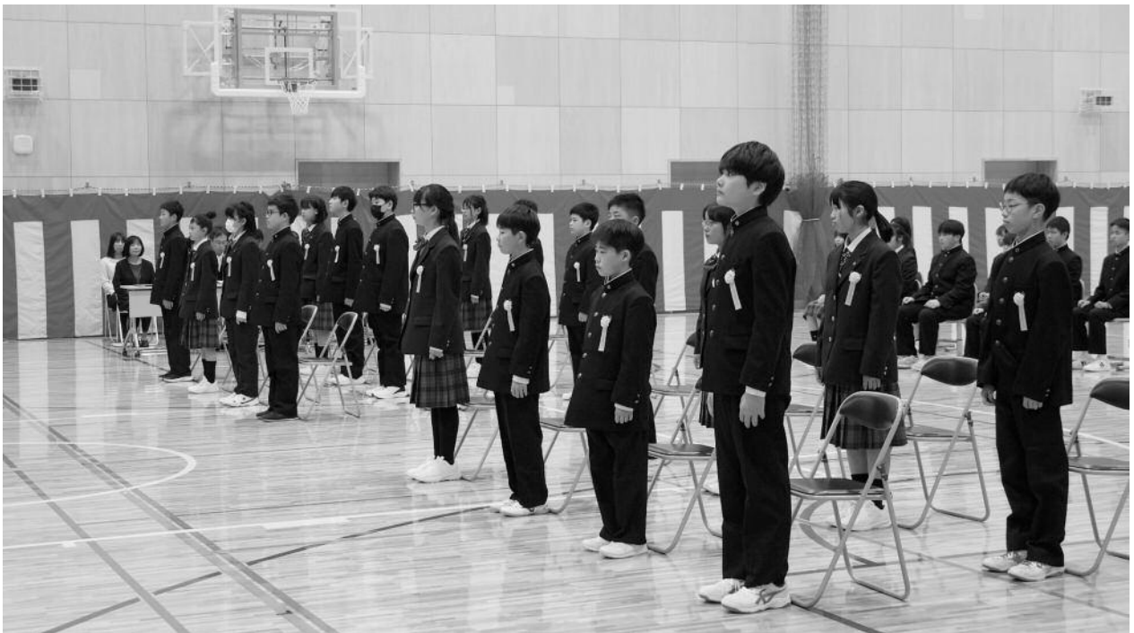
壮瞥中学校 新校舎で最初の入学式