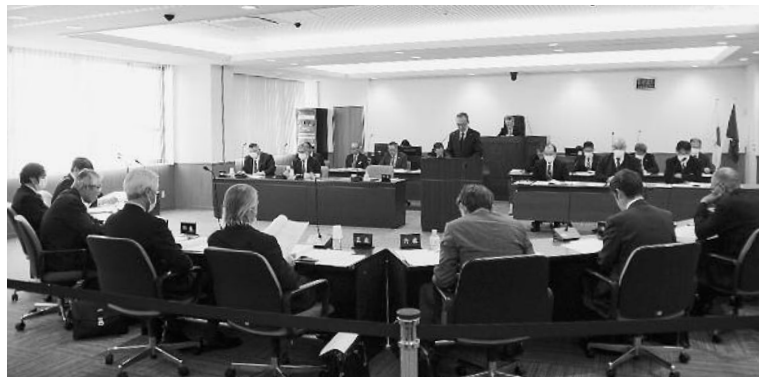
第1回定例会の様子

保育所に通っていない0歳6か月から満3歳未満の子どもを月一定時間までの利用可能枠で、保護者の就労要件を問わず通園を可能