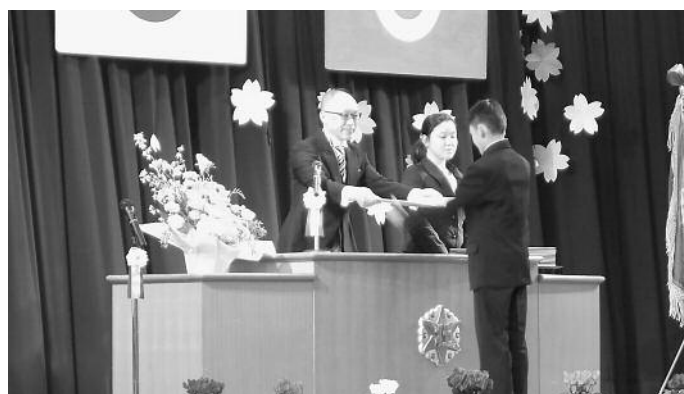
壮瞥小学校 卒業式