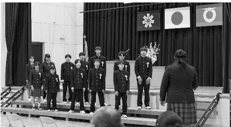
壮瞥中学校 卒業式

2 点目について、端末は鉛筆やノートと同様に学習を支える文房具としての手段であると位置づけ、児童・生徒の学力や学習状況を把握・分析し、各学校の校内研修において、ICTを用いた授業公開や研究協議を重ね、どの場面でデジタルが最も有効に機能したかを教員間で具