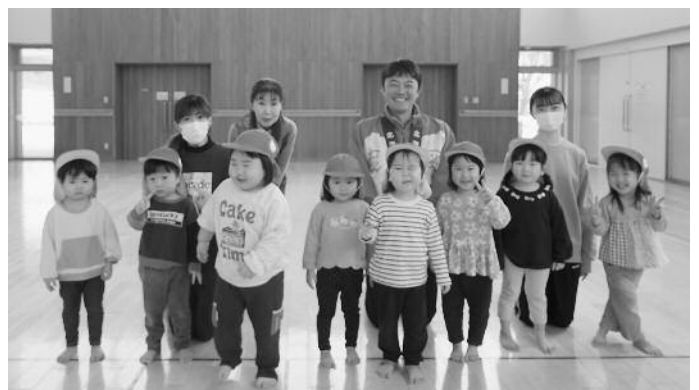
そうべつ保育所園児へ帽子贈呈