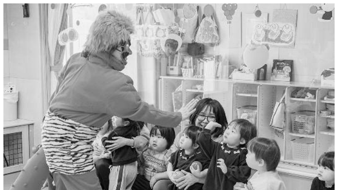
そうべつ保育所 節分