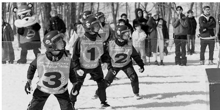
第37回昭和新山国際雪合戦